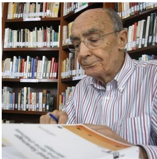
Saramago, en su casa de Lanzarote en 2009